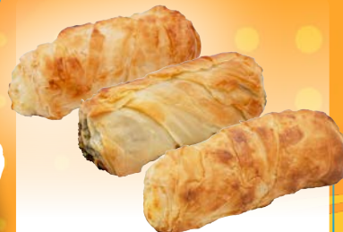
Art. 2854* Mini-Börek Mischkiste, 3-fach sortiert

Maße: L 17,5 x B 3,6 x H 2,0 cm Gewicht: 100 g, 60 St./Kt. ❄️ Teigling