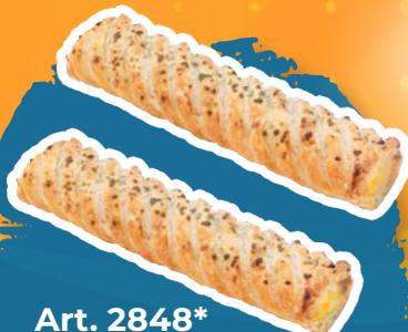
Art. 2848* Blätterteigstange Pistazie-Vanille

Maße: Ø 6,0 x H 3,8 cm Gewicht: 50 g, 48 St./Kt. ❄️ fertig gebacken