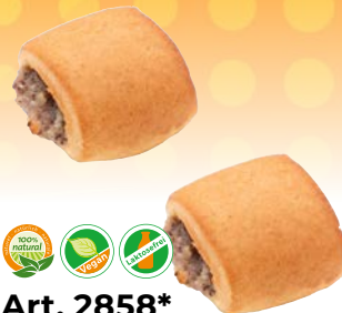
Art. 2858* FF-Morning-Bites

Maße: L 9,0 x B 4,0 x H 3,0 cm Gewicht: 50 g, 150 St./Kt. ❄️ Teigling