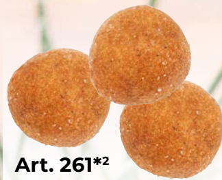
Art. 261*2 SG-Winterbällchen mit Quark und Lebkuchengewürz

Maße: Ø 4,0 x H 4,0 cm Gewicht: 15 g, 150 St./Kt.