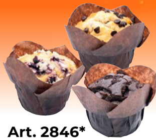
Art. 2846* Mix Box Muffins, 3-fach sortiert

Maße: Ø 7,5 x H 5,5 cm Gewicht: 90 g, 36 St./Kt. ❄️ fertig gebacken