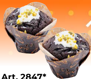
Art. 2847* Premium Schoko-Pistazien-Muffin

Maße: Ø 7,5 x H 5,5 cm Gewicht: 90 g, 36 St./Kt. ❄️ fertig gebacken