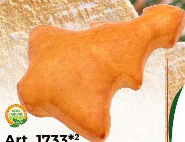
Art. 1733*2 FF-Tannenbaum

Maße: L12,0 x B12,0 x H2,0 cm Gewicht: 60 g, 40 St./Kt.