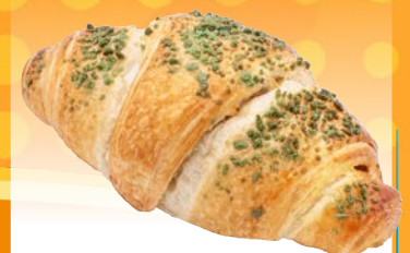
Art. 3129* Croissant Pistaziencreme

Maße: L 13,2 x B 6,5 x H 4,0 cm Gewicht: 100 g, 60 St./Kt. ❄️ Teigling