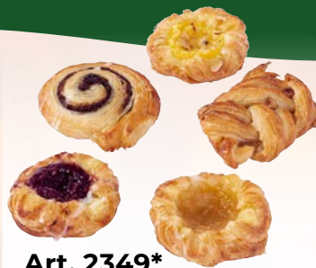
Art. 2349* SG-Dänisches Plundergebäck, 5-fach sortiert