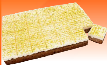
Art. 2798* Rübli Schnitte nach amerikanischer Art

Maße: L 37,5 x B 24,5 x H 3,9 cm Gewicht: 2.200 g, 4 Pl./Kt. ❄️ fertig gebacken