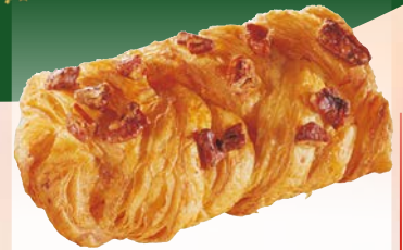
Art. 80149* Pecantasche

Maße: L11,5 x B6,5 x H2,5 cm Gewicht: 95 g, 48 St./Kt.