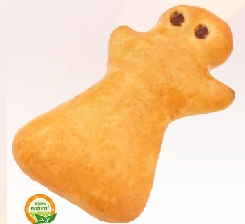
Art. 1353*2 FF-Weihnachtsengel

Maße: L15,0 x B8,0 x H2,5 cm Gewicht: 60 g, 40 St./Kt.