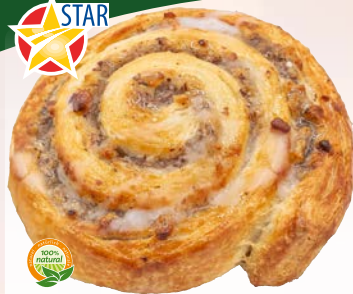
Art. 477* Nusschnecke

Maße: Ø 9,5 x H 3,0 cm Gewicht: 140 g, 50 St./Kt.