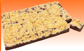
Art. 2797* Kirsch-Kakao-Schnitte

Maße: L 37,5 x B 24,5 x H 3,9 cm Gewicht: 2.200 g, 4 Pl./Kt. ❄️ fertig gebacken