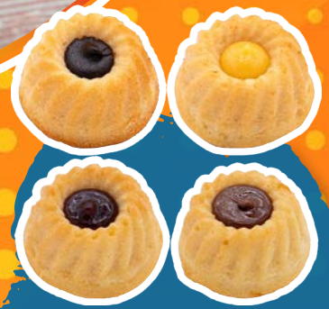
Art. 2902* Gefüllte Mini Gugelhupf Mischkiste, 4-fach

Maße: Ø 6,0 x H 3,8 cm Gewicht: 50 g, 48 St./Kt. ❄️ fertig gebacken