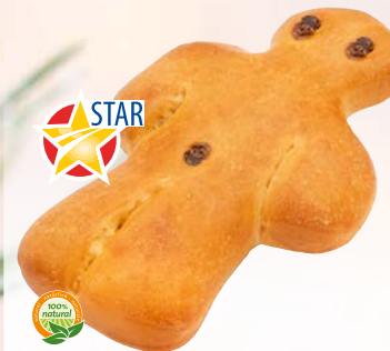
Art. 573*2 Lucky EDNA

Maße: L13,5 x B10,0 x H2,3 cm Gewicht: 50 g, 30 St./Kt.