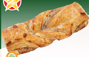
Art. 476* Nuss-Schleife

Maße: L16,0 x B7,0 x H3,0 cm Gewicht: 140 g, 50 St./Kt.