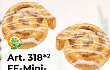
Art. 318*2 FF-Mini-Winterschnecke

Maße: Ø 7,0 x H 2,5 cm Gewicht: 40 g, 75 St./Kt.