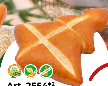
Art. 2554*2 FF-Laugentannenbaum

Maße: L13,0 x B12,0 x H2,5 cm Gewicht: 60 g, 40 St./Kt.