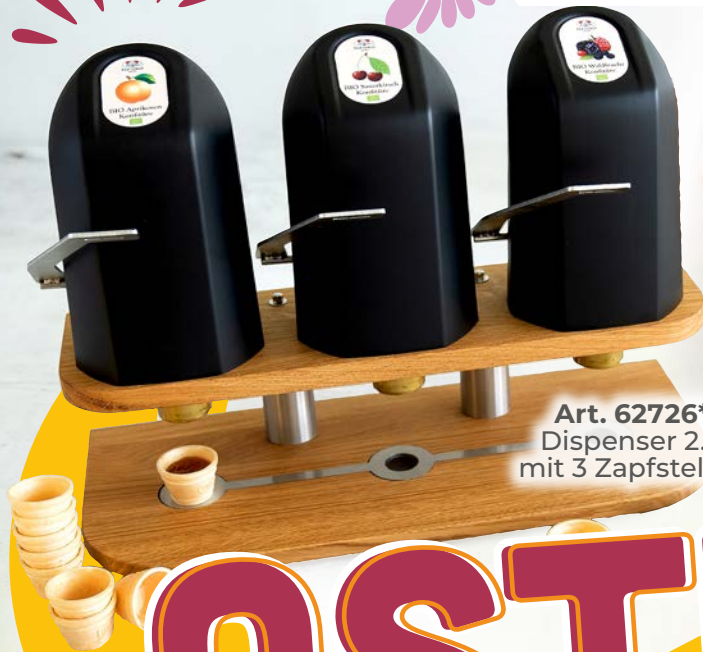
Art. 62726* Dispenser 2.0 mit 3 Zapfstellen