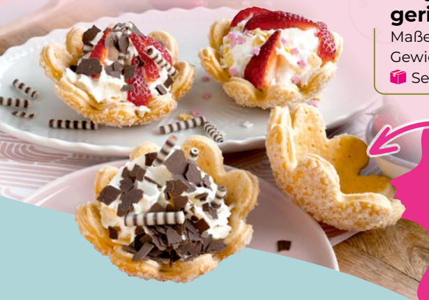
Art. 90041* Butter-Blumenmuschel

Maße: Ø 17,0 x H 2,0 cm Gewicht: 128 g, 12 St./Kt. Service-Welt