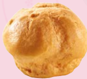
Art. 57001* Pidy Profiterole

Maße: L 13,0 x B 5,9 x H 4,8 cm Gewicht: 30 g, 72 St./Kt. Service-Welt