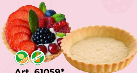
Art. 61059* Pidy Mürbteig-Törtchen geriffelt, süß

Maße: L 6,0 x B 3,0 x H 2,5 cm Gewicht: 2,2 g, 250 St./Kt. Service-Welt