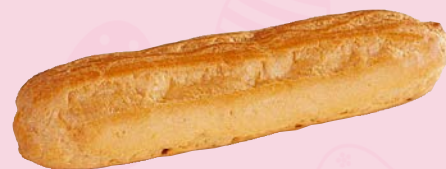
Art. 57875* Butter-Éclair,

Maße: Ø 7,5 x H 5,5 cm Gewicht: 11 g, 120 St./Kt. Service-Welt