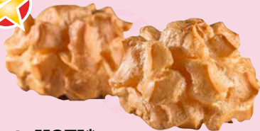
Art. 11271* Butter-Windbeutel