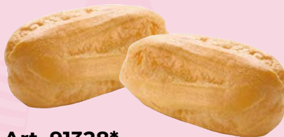
Art. 91328* Pidy Mini-Éclair

Maße: Ø 4,0 x H 3,6 cm Gewicht: 2,4 g, 250 St./Kt. Service-Welt