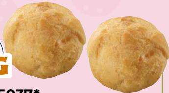
Art. 35037* HUG Mini-Windbeutel

Maße: Ø 4,0 x H 3,0 cm Gewicht: 1,9 g, 300 St./Kt. Service-Welt