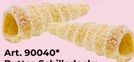
Art. 90040* Butter-Schillerlocke

Maße: L 13,0 x B 5,9 x H 4,8 cm Gewicht: 30 g, 72 St./Kt. Service-Welt