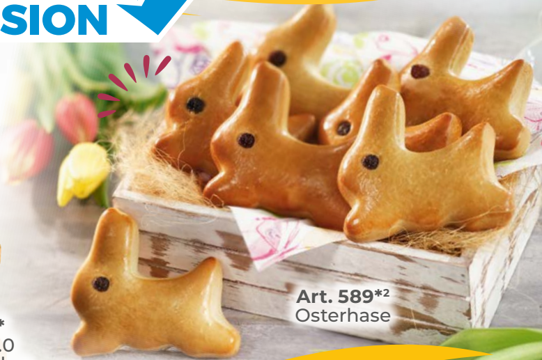
Art. 589*2 Osterhase