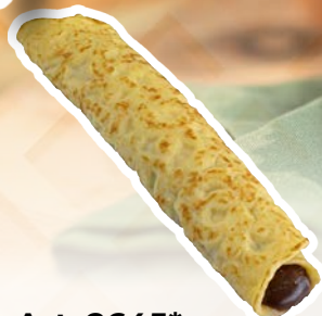
Art. 2645* Crêpe con crema di noci e nocciola

Misure: 113,5 x b 9,5 x h 3,0 cm Peso: 90 g, 40 pz./ct. ❄️ Già pronto