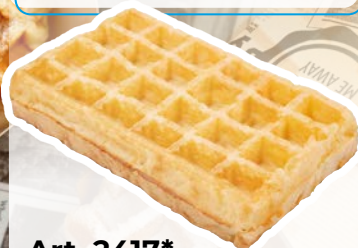
Art. 2417* Cialda di Bruxelles

Misure: 123,0 x b 18,0 x h 7,0 cm Peso: 1.000 g, 5 sac./ct. 🏠 Service-World