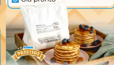
Art. 93261* Preparato per pancake

Misure: Ø4,0 x h 2,5 cm Peso: 8,3 g, 360 pz./ct. ❄️ Già pronto