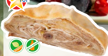
Art. 629* Strudel di mele, porzionato

Misure: 111,0 x b 3,1 x h 4,8 cm Peso: 100 g, 40 pz./ct. ❄️ Già pronto