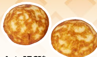
Art. 1361* Mini Pancake

Misure: Ø8,0 x h 0,5 cm Peso: 20 g, 120 pz./ct. ❄️ Già pronto