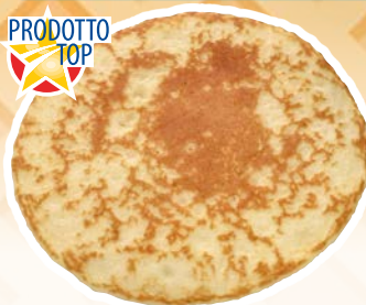
Art. 1301* Pancake

Misure: Ø10,0 x h 0,5 cm Peso: 40 g, 120 pz./ct. ❄️ Già pronto