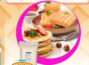
Art. 93111* Preparato per cialda belga

Misure: 16,0 x b 5,5 x h 1,6 cm Peso: 15 g, 120 pz./ct. ❄️ Già pronto