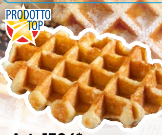
Art. 1304* SG-Cialda belga al burro

Misure: 113,5 x b 9,5 x h 3,0 cm Peso: 90 g, 40 pz./ct. ❄️ Già pronto