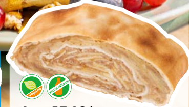
Art. 1549* Strudel di mele, porzionato

Misure: 111,0 x b 3,1 x h 4,8 cm Peso: 100 g, 40 pz./ct. ❄️ Già pronto