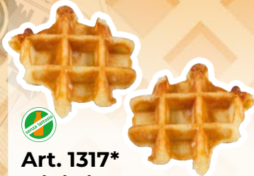
Art. 1317* Mini cialde con granella di zucchero

Misure: 117,0 x b 10,0 x h 3,0 cm Peso: 85 g, 24 pz./ct. ❄️ Già pronto