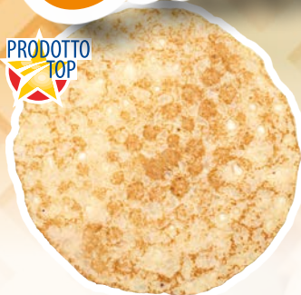
Art. 1367* Crêpe al naturale

Misure: Ø18,0 x h 0,2 cm Peso: 62,5 g, 80 pz./ct. ❄️ Già pronto